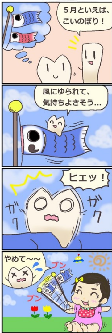
4コマ、イラスト Dr.美美

こんにちは、渡辺歯科医院です。 今年のゴールデンウィークは土日を含めるととても大きかったですね。 どこか旅行に行った方、この機に用事を済ませられた方...逆に祝日のほうが忙しくなる方もおられたことだと思います。