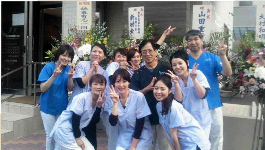
昨年十月三十、三十一日の 内覧会時の様子